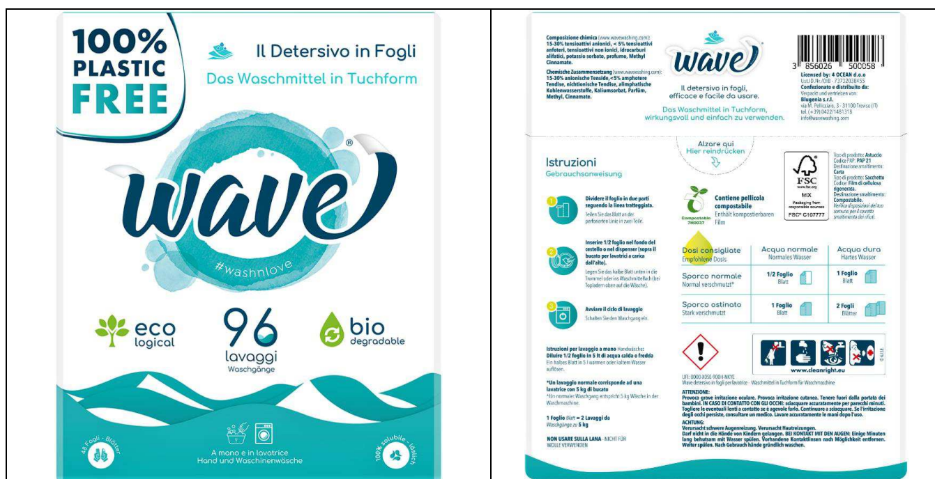
Fig. 1 – Confezione commerciale della sostanza in prova

Il Committente ha inviato al laboratorio di prova un campione denominato WAVE DETERSIVO IN FOGLI. Si tratta di un detersivo per bucato in lavatrice, innovativo e a basso impatto ambientale. Per maggiori dettagli si veda la confezione riportata in Fig. 1.