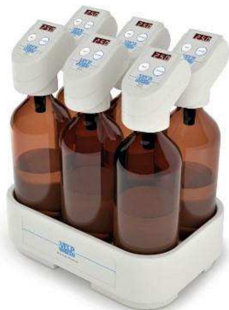
Fig. 2 – Il respirometro VELP usato per il test

PASS LEVEL: per definire una sostanza prontamente biodegradabile, il pass level per la biodegradabilità è del 60% con riferimento al ThOD o al COD.